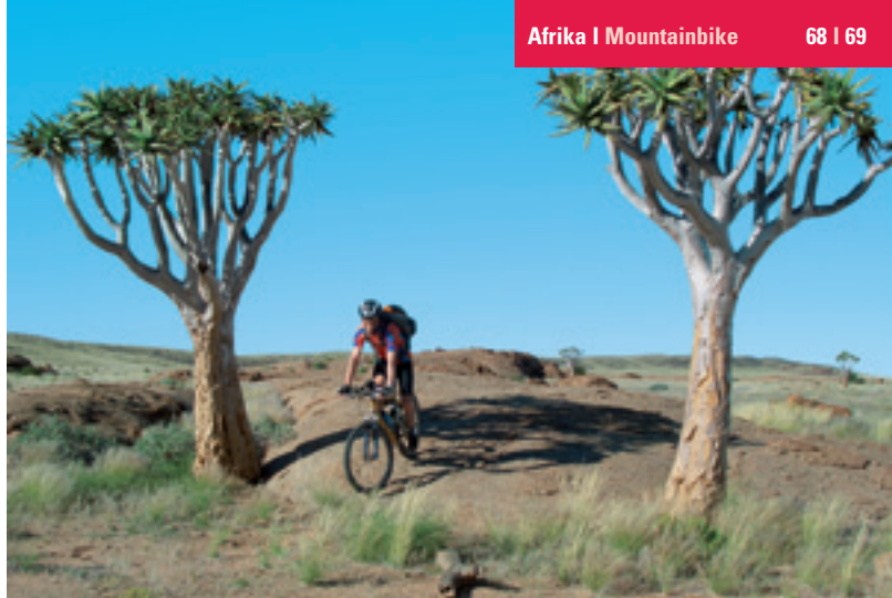
Fotos: Rolf Heinisch, Jackie Truffer, Fred Chiappori, Andrew Bassingtwaighte

Detailinfos / Reservation / Buchungsstand / Fotos: www.bikereisen.ch