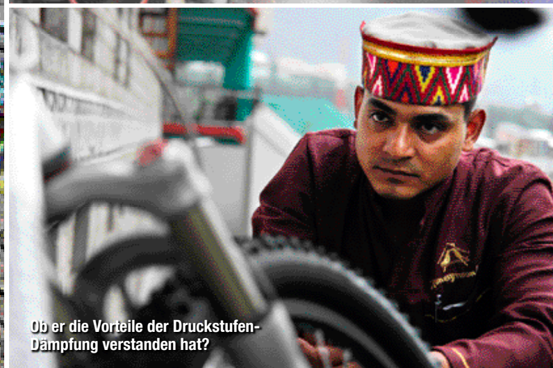
Ob er die Vorteile der Druckstufen-Dämpfung verstanden hat?

sigen Gebirgsbächen und vielen unvergesslichen Momenten erreichen wir Leh. Doch die größte Herausforderung liegt noch vor uns: der Kardung La. Wir starten früh, um der Mittagshitze zu entkommen. Die 39 Kilometer Aufstieg werden zu einer Ewigkeit, begleitet vom Pfeifen unserer Lungen. Nur noch fünfhundert Meter! Mit letzter Kraft erreichen wir gemeinsam die Passhöhe.