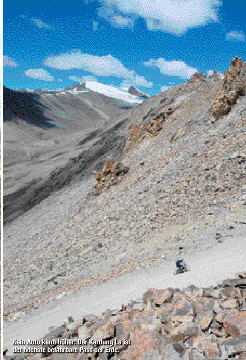
Kein Auto kann höher: Der Kardung La ist der höchste befahrbare Pass der Erde.