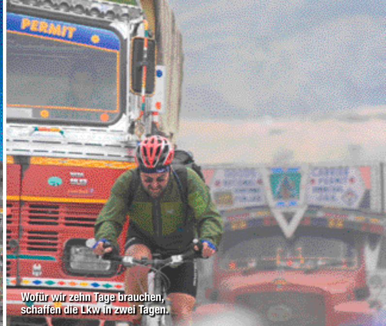
Wofür wir zehn Tage brauchen, schaffen die Lkw in zwei Tagen.