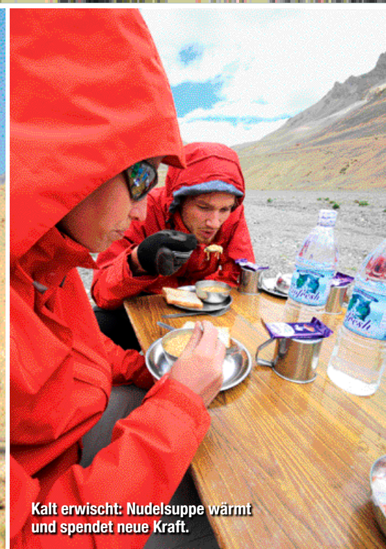
Kalt erwischt: Nudelsuppe wärmt und spendet neue Kraft.