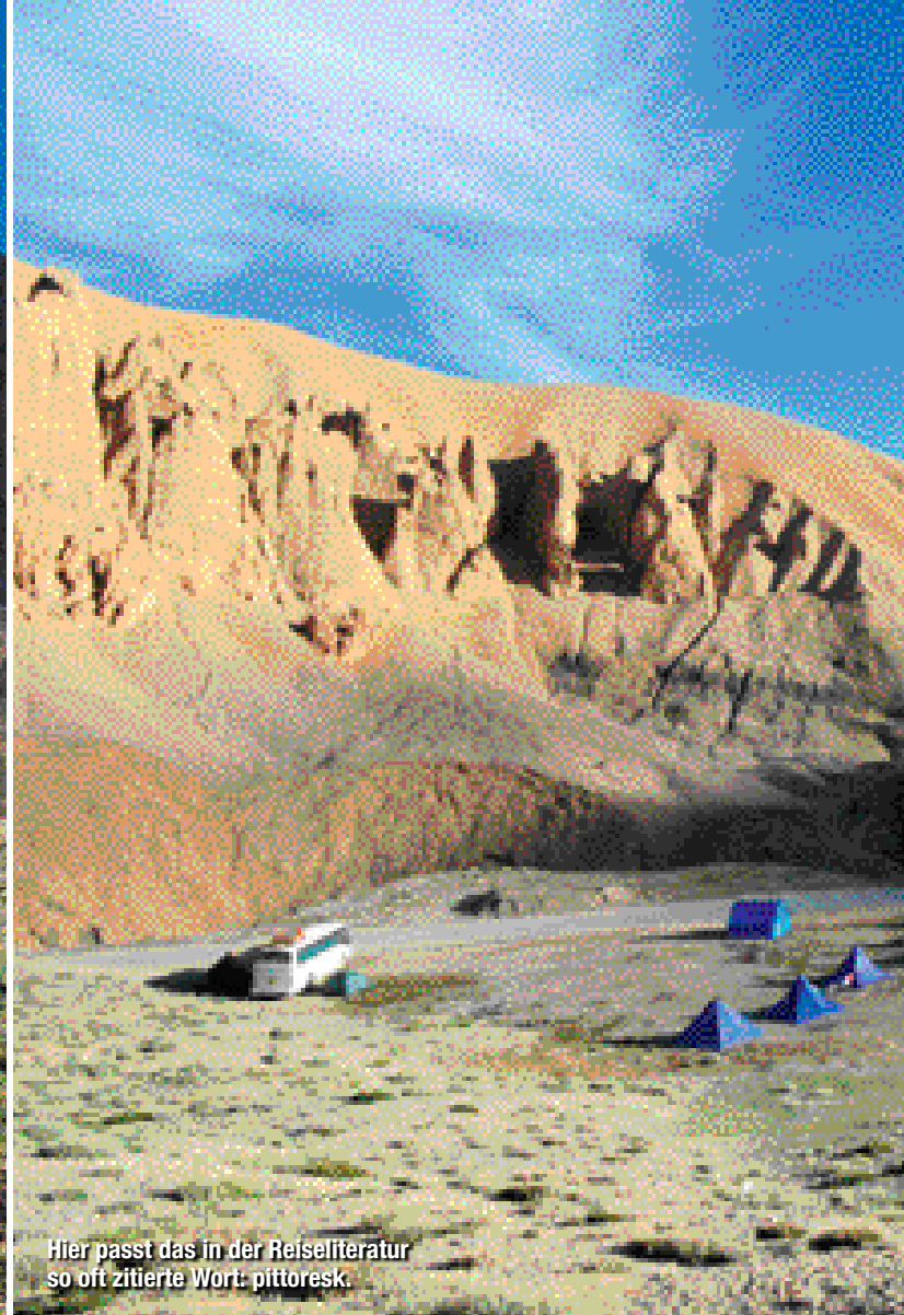
Hier passt das in der Reiseliteratur so oft zitierte Wort: pittoresk.