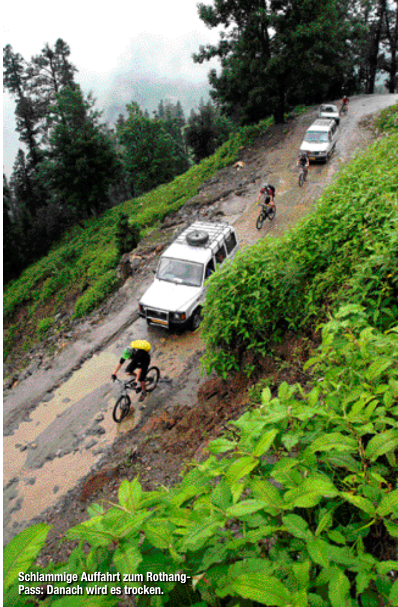
Schlammige Auffahrt zum Rothang-Pass: Danach wird es trocken.