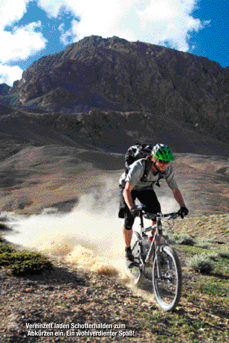
Vereinzelt laden Schotterhalden zum Abkürzen ein. Ein wohlverdienter Spaß!