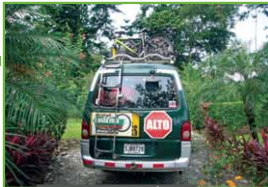
BEI 100 PROZENT LUFTFEUCHTIGKEIT LÄSST MAN

Überhaupt ist das mit der viel gerühmten Fauna Costa Ricas so eine Sache: Die größeren Tiere bekommt man höchst selten zu Gesicht, die kleineren will man gar nicht immer sehen. Einmal kämpfen wir an einem Rastplatz mit einem reinrenten Waschbären, der uns die Power-Bananen aus dem Rucksack klaut. Ein andermal verlassen wir unsere Cabana fluchtartig, weil Ameisen samt ihren Eiern im Hunderter-Pack von der Decke tropfen. Auch Schlangen begegnen wir, doch sehen wir sie nur kurz, denn der Blick haftet meist starr auf unserem 2,25er-Nobby-Nic und den Schlaglöchern, die er auf den ruppigen Naturstraßen zu umkurven hat.