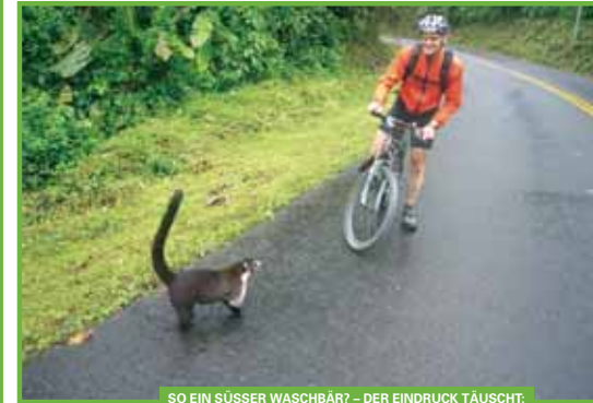
So ein süßes Waschbär? – Der Eindruck täuscht: