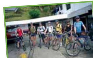
Noch blitzen die Bikes – Der nächste

Zurück im zentralen Hochland mit seinen Vulkanen sehen wir dann auch die ersten einheimischen Biker und Rennradfahrer. Wir hatten uns schon gewundert, wo sich die verstecken. Denn dass sie zu den Chefs auf dem MTB gehören, hatten wir schon gewusst. Bei der TransAlp Challenge 2006 verfehl-