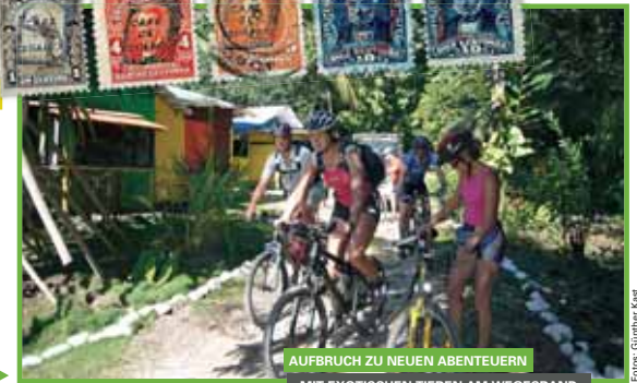
AUFBRUCH ZU NEUEN ABENTEUERN MIT EXOTISCHEN TIEREN AM WEGESRAND