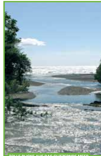
TOLLE Blicke auf das glitzernde Meer

SICH OHNE SCHLECHTES GEWISSEN AUCH MAL SHUTTLELN